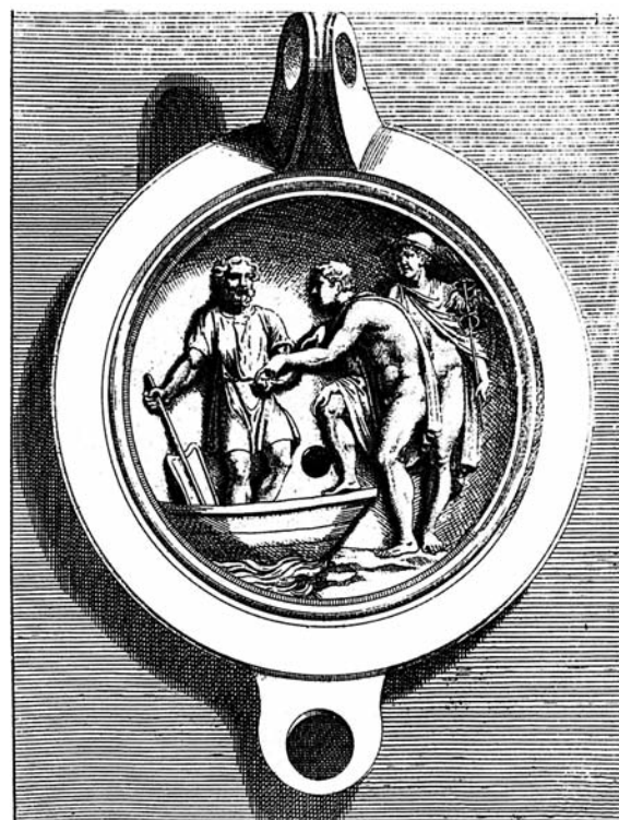
Figuur 6. Gravure van olielamp met afbeelding van Charon, Mercurius en overledene.

Het geloof in een hiernamaals heeft ervoor gezorgd dat de overledene in zorgvuldig aangelegde graven werd bijgezet en allerlei grafgiften heeft meegekregen. Uit de Griekse oudheid dateert het gebruik om in de mond van de dode een muntje te leggen. Dit geldstuk diende om de veerman, Charon, te betalen, die de overledene in een boot over de rivier de Styx naar de onderwereld moest overvaren (figuur 6). Deze zogenaamde Charonpenning werd zelfs in vroegmiddeleeuwse graven aangetroffen.