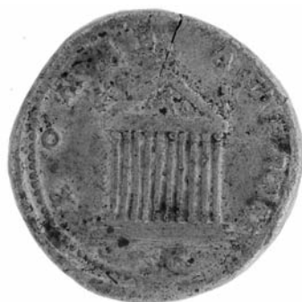
Figuur 2. Bronzen sestertius van Antoninus Pius (138-161) met afbeelding van een tempel.