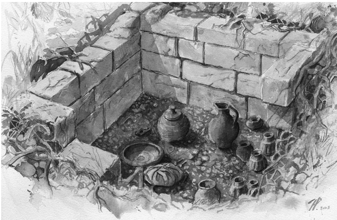
Figuur 7. Aquarel van mergelstenen graf in het Bemelderveld. Als grafgift heeft de overledene een hele set drinkbekers meegekregen.

De Parcae (= de schikgodinnen) spelen een belangrijke rol bij de levensduur van stervelingen. Zij weven de levensdraad maar breken hem ook weer af en bepalen zodoende hoe lang een mens leeft. Een door