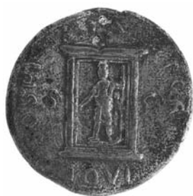
Figuur 3. Bronzen as van Geta (211-212) met afbeelding van Jupiter in een tempel.