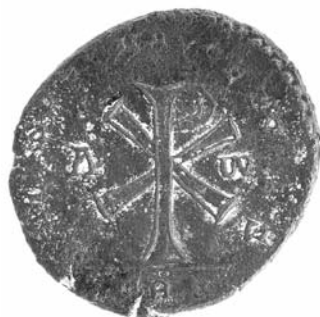
Figuur 4. Bronzen aes van Magnentius (350-353) met afbeelding van het Christusmonogram en de alfa en omega.

Voorwerpen voorzien van christelijke symboliek wijzen op de introductie van een nieuwe cultus vanaf het einde van de Romeinse tijd. Het gaat daarbij om de alfa en de omega (gods almachtigheid), het Christusmonogram (chi rho-teken), de duif (de heilige geest), ICHTUS (behorend tot de christengemeenschap) en het kruis. We zien deze symbolen op aardewerk, glas en metalen voorwerpen verschijnen. Veel van deze voorwerpen gaan terug op prototypes in de Romeinse tijd.