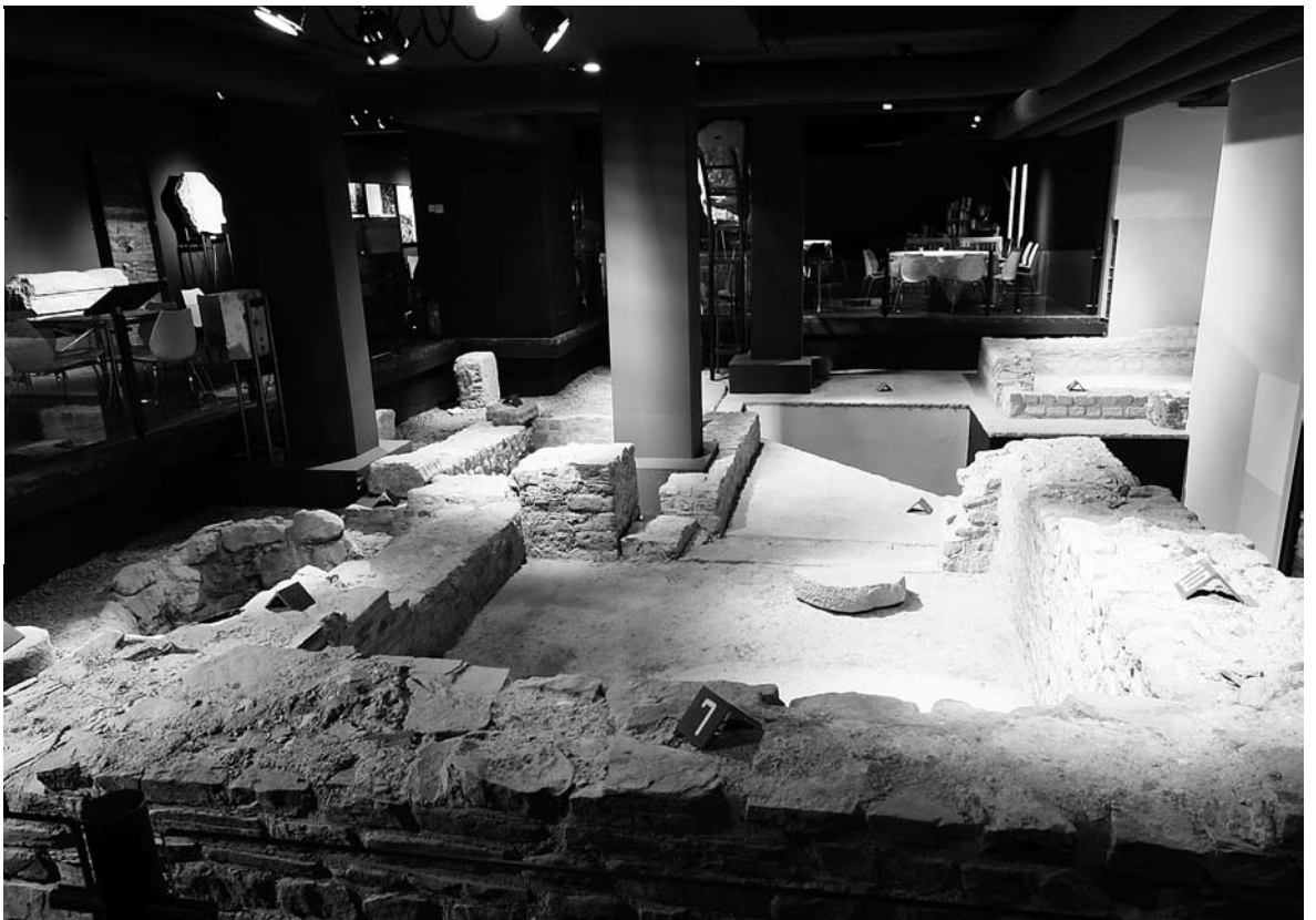
Figuur 1. Het Romeinse heiligdom is gedeeltelijk geconserveerd in de museumkelder onder Hotel Derlon, die sinds de verbouwing in 2007 de naam Piazza Romana draagt.

In Centre Céramique te Maastricht wordt vanaf juni 2008 tot januari 2009 een tentoonstelling gehouden, die beide thema's met elkaar verbindt. Het geloof wordt daarbij als rode draad gebruikt: het geloof in god(en) en het geloof in het hiernamaals. Een passende titel voor een expositie over deze thema's luidt: over goden en doden.