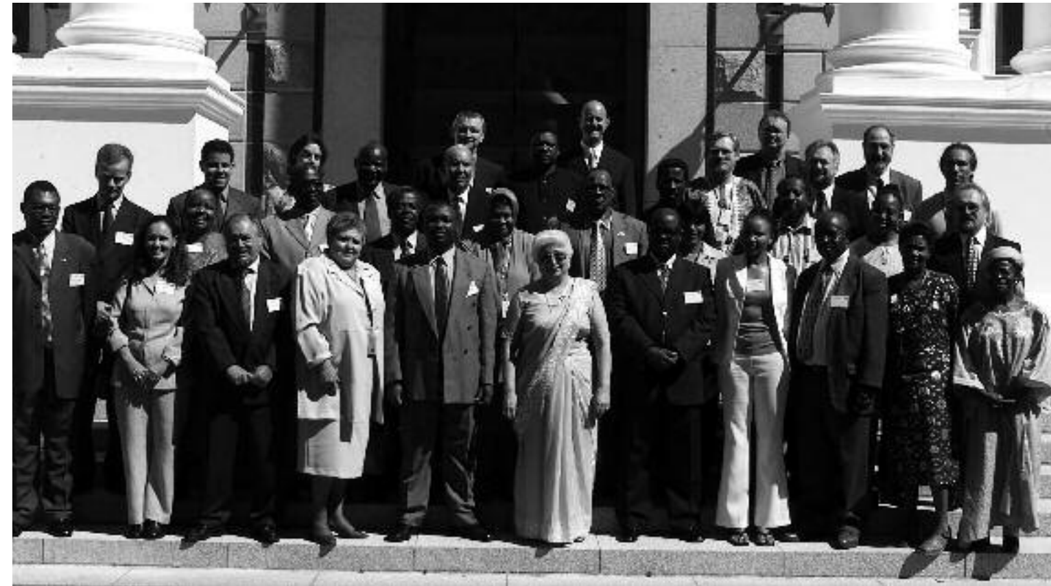
Groepsfoto van parlementariërs uit zuidelijk Afrika en stafleden van het ECDPM voor het parlamentsgebouw in Kaapstad, Zuid-Afrika. Foto 2003.

vraag door de regering Major. Pas op 1 november, drie maanden na de oorspronkelijk beoogde datum, treedt het Verdrag in werking'.