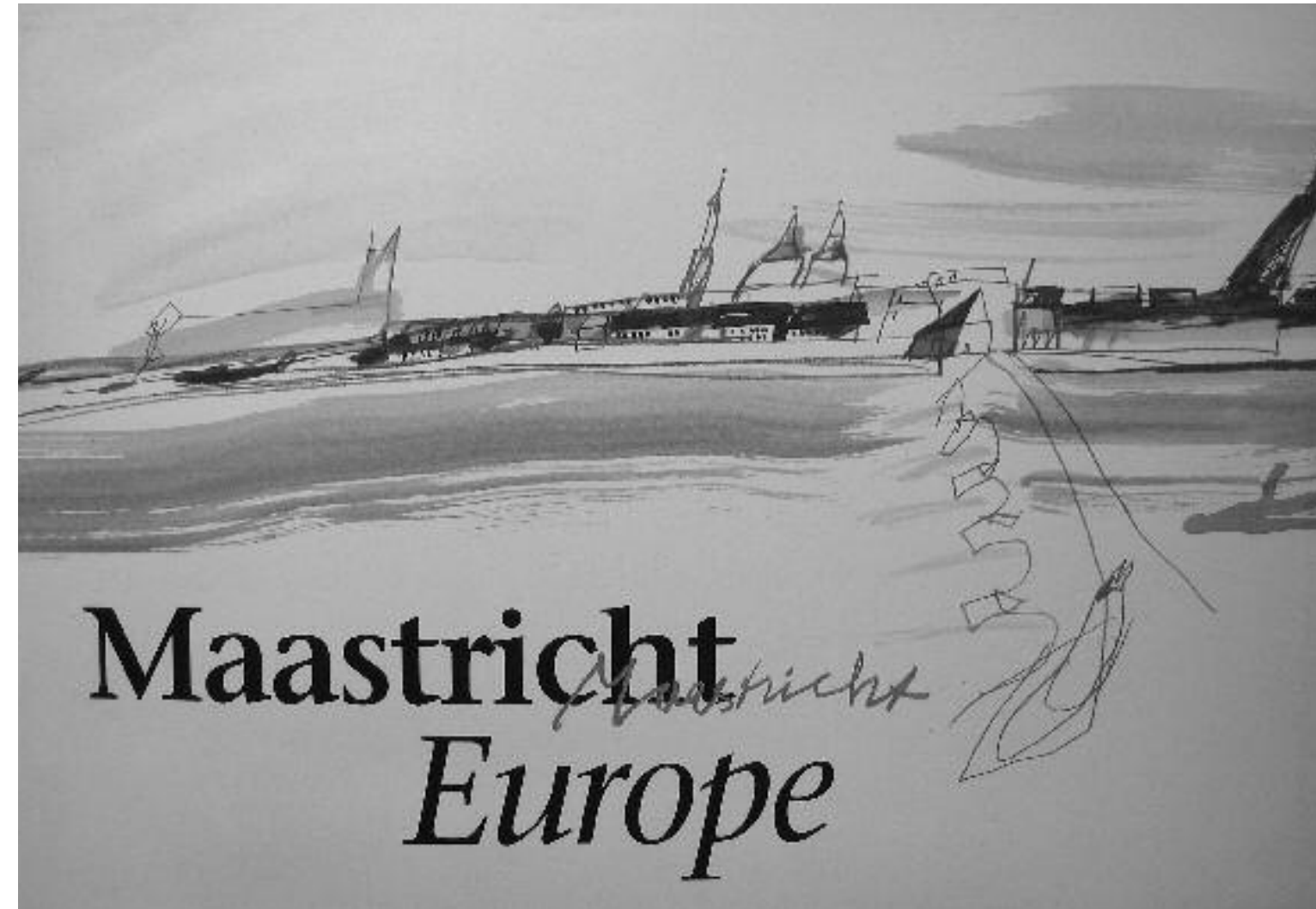
Maastricht Europe, omslag van een brochure, ontworpen door Guus van Eck, uitgegeven in november 1991.