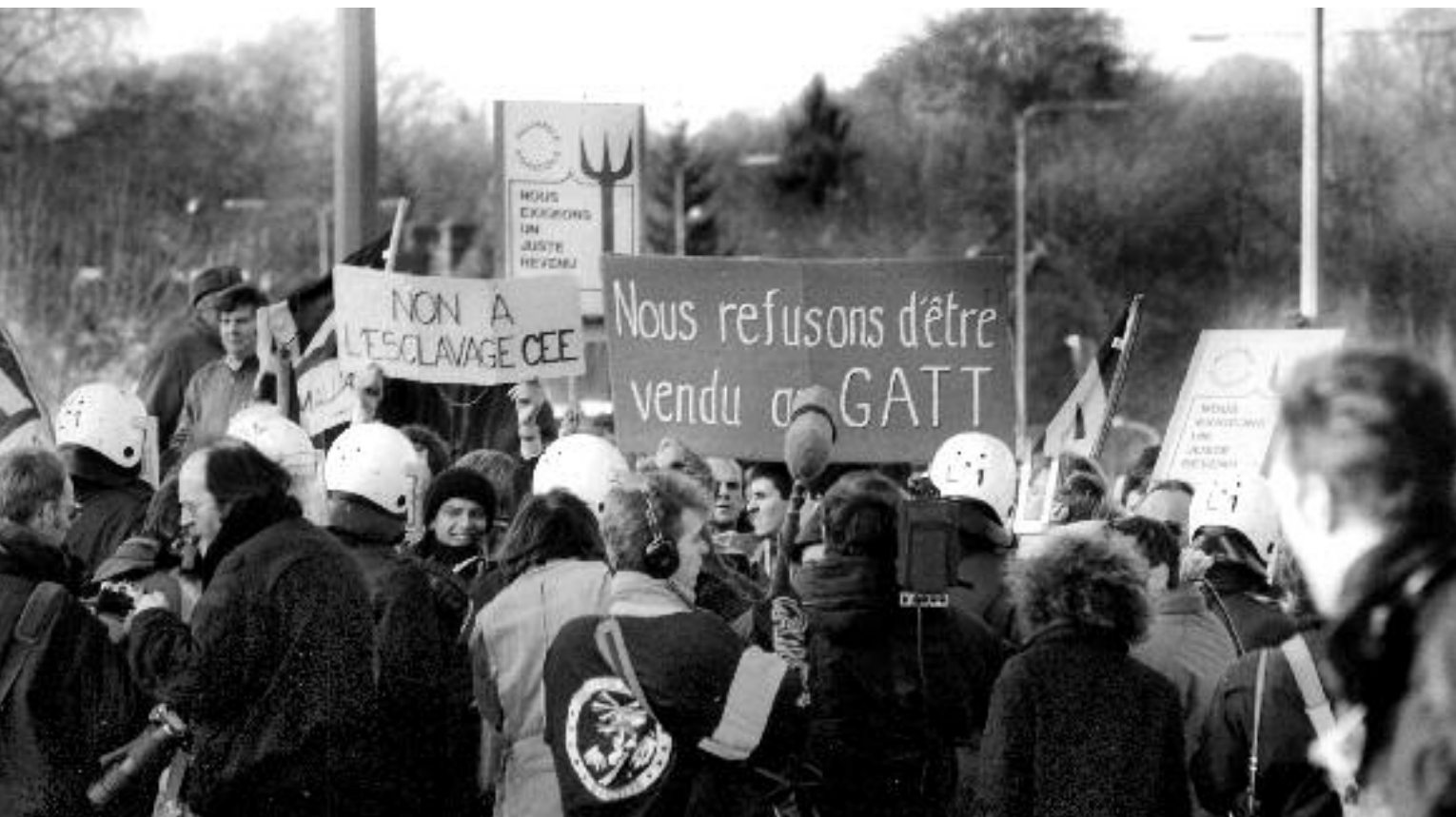
Protestactie van Waalse boeren tijdens de Eurotop 1991.