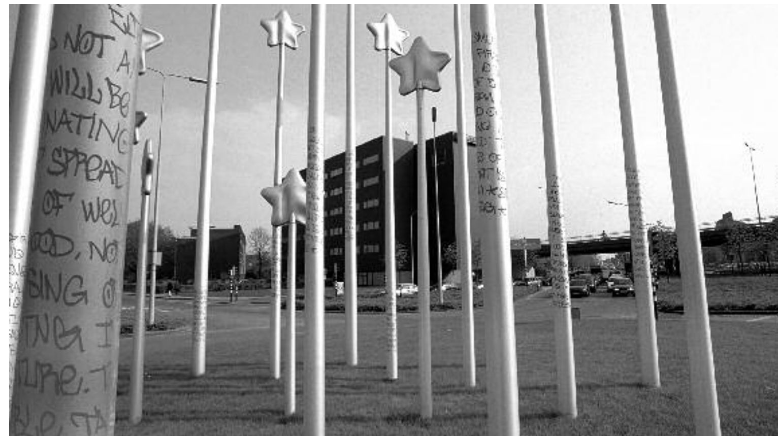
Het Sterrenmonument ter herinnering aan het Verdrag van Maastricht (1992), gemaakt door de Italiaanse kunstenares Maura Biava. Het monument staat op de rotonde in de Avenue Ceramique en werd op 8 februari 2002 onthuld.

Een jaarlijks succes is 'The European Fine Art Fair' (TEFAF), een kunstbeurs die elk jaar groter en exclusiever wordt.