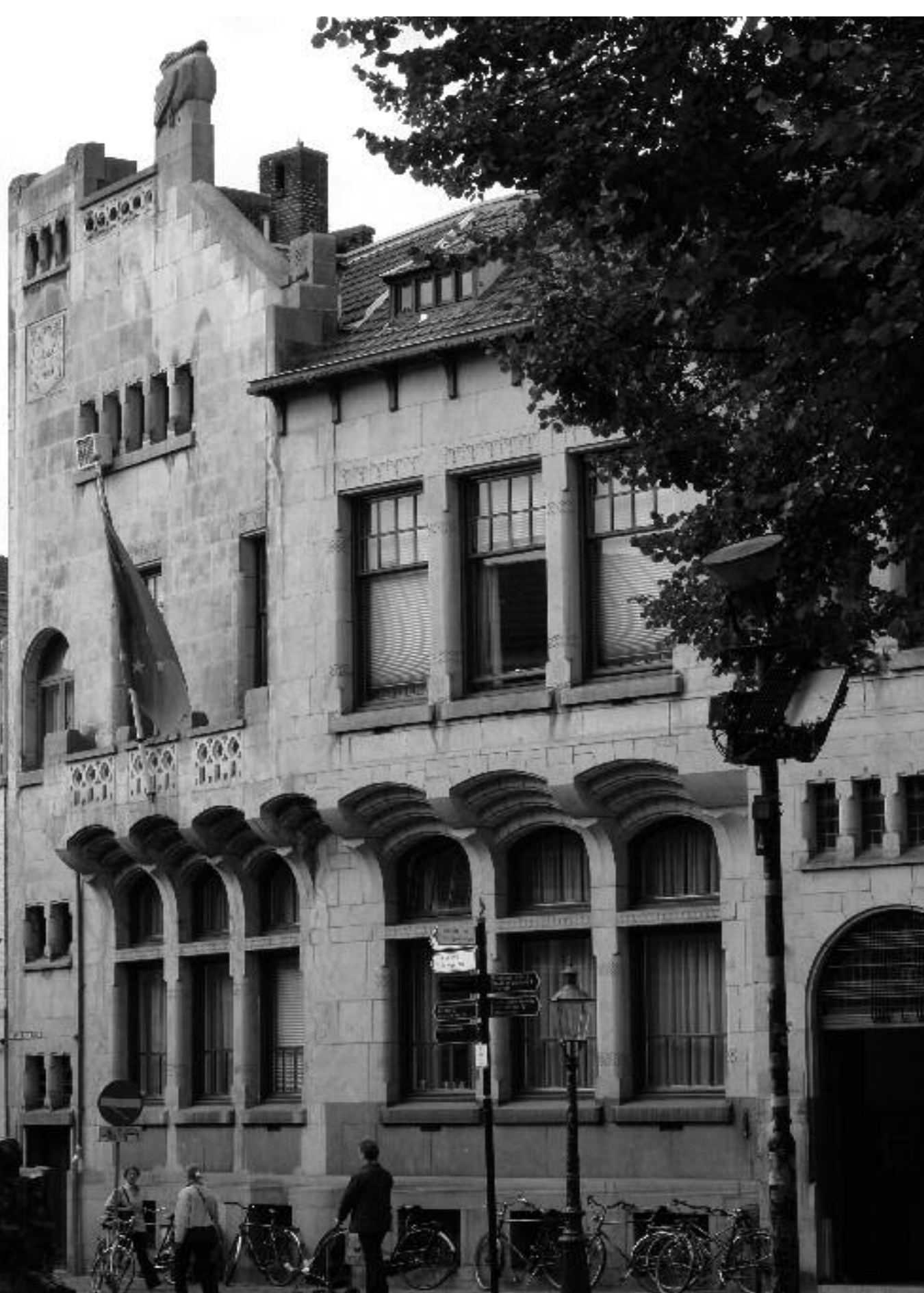
Europees Instituut voor Ontwikkelingsmanagement (ECDPM), gevestigd in het Huis met de Pelikaan, O.L. Vrouweplein 21.

Het Instituut had als doelstelling de kennis van het openbaar bestuur in Europees verband door wetenschappelijk onderzoek te vergroten. Ook het verzorgen van publicaties en het organiseren van cursussen voor ambtenaren uit Europese landen behoorden tot de doelstellingen van het Instituut. Het European Institute of Public Administration (EIPA) - gevestigd aan het O.L. Vrouweplein 22 in Maastricht - heeft inmiddels een prominente plaats weten te veroveren. Het ziet zichzelf als een onafhankelijk instituut dat trainingen verzorgt en onderzoek uitvoert op het gebied van openbaar bestuur. Ook verleent het diensten aan de lidstaten van de Europese Unie op verschillende terreinen. De Europese Commissie ondersteunt de activiteiten en de publicaties van het EIPA. Momenteel is de geformuleerde missie: het ondersteunen van de Europese Unie en de lidstaten daarvan en de landen die geassocieerd zijn met EIPA door het verlenen van relevante en hoog gekwalificeerde diensten. Doel is het ontwikkelen van de capaciteiten van 'public officials' in het omgaan met Europese zaken. Het EIPA heeft een vaste staf van ruim honderd leden en organiseert inmiddels meer specifieke activiteiten in Luxemburg, Barcelona en Milaan. Voor het Europese gezicht van de stad Maastricht verdient het Europees Instituut voor Bestuurskunde bijzondere aandacht.