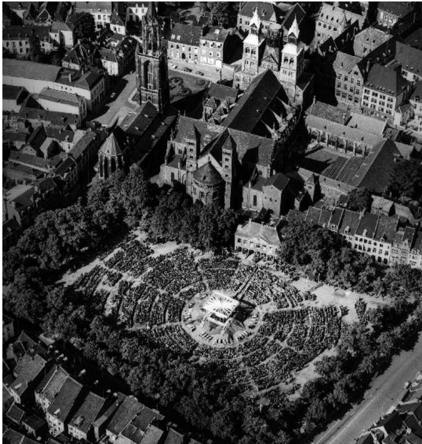
Luchtfoto van het Vrijthof met een misviering tijdens de Heiligdomsvaart in 1962.

op haar wortels. De oude gevoelens van trots op de stad en het religieuze gevoel bleken nog onverminderd te bestaan. Maar na de sluiting van het Concilie in 1965 kwam de modernisering in de kerk en in 1969 paste men het programma dan ook aan de nieuwe tijd aan. Er was een uitgebreide en feestelijke ommegang, maar de inmiddels ouderwets gevonden reliektoningen kwamen te vervallen en werden vervangen door tentoonstellingen. De reliekhouders konden worden bekeken in de vernieuwde schatkamer van de Sint-Servaaskerk, waarbij de nadruk op hun culturele en historische achtergrond kwam te liggen. De organisatie had de zaken groots aangepakt, het accent lag op de Limburgse folklore. Naar schatting 100.000 bezoekers kwamen naar Maastricht.