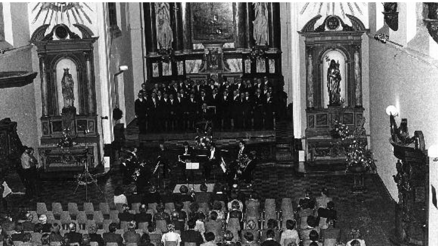
Opening van de gerestaureerde Sint Jozefkerk (Awwe Stiene) in 1976, beschikbaar gesteld voor culturele manifestaties.

Lage Barakken en van de zusters reparatrices aan de Kapoenstraat. Andere kloosters kregen een nieuwe functie. In het voormalige klooster aan de Sint-Maartenspoort kwam de nieuwe huisvesting van de Stedelijke Muziekschool. Het Leger des Heils betrok het voormalige klooster van de zusters van het Arme Kind Jezus aan de Boschstraat en richtte het in als opvanghuis voor daklozen; hun kloostergebouw aan de Brusselseweg diende jaren later tot huisvesting van de paedagogische academie. Het Trichtercollege vestigde zich in het voormalige broederjuvenaat aan de Tongerseweg. In 1995 kreeg een stichting het beheer over de Cellebroederskapel van de broeders van de Beyart. De broeders gebruikten de kapel al jaren niet meer. Niet alleen het aantal kloosters nam af, maar ook verminderde de actieve aanwezigheid van de kloosterlingen zelf. In 1982 namen de zusters Onder de Bogen afscheid van het Sint-Annadalziekenhuis, waar ze 140 jaar werkzaam waren geweest. Eerder waren al vele kloosterlingen, actief in het jongerenwerk, de zorg voor ouderen of