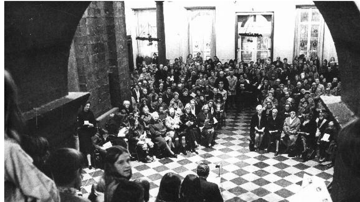
Volkskerstzang in het Stadhuis op 18 december 1974.

Hoewel de schijn soms anders is, toch bestaat Maastricht niet alleen uit katholieken. Maar andersdenkenden konden zich tot de jaren 1960 niet verheugen in een warme belangstelling. De protestanten kregen als eerste enige aandacht. Het begon met een oecumenische jongerenbijeenkomst in het Staargebouw in 1960.