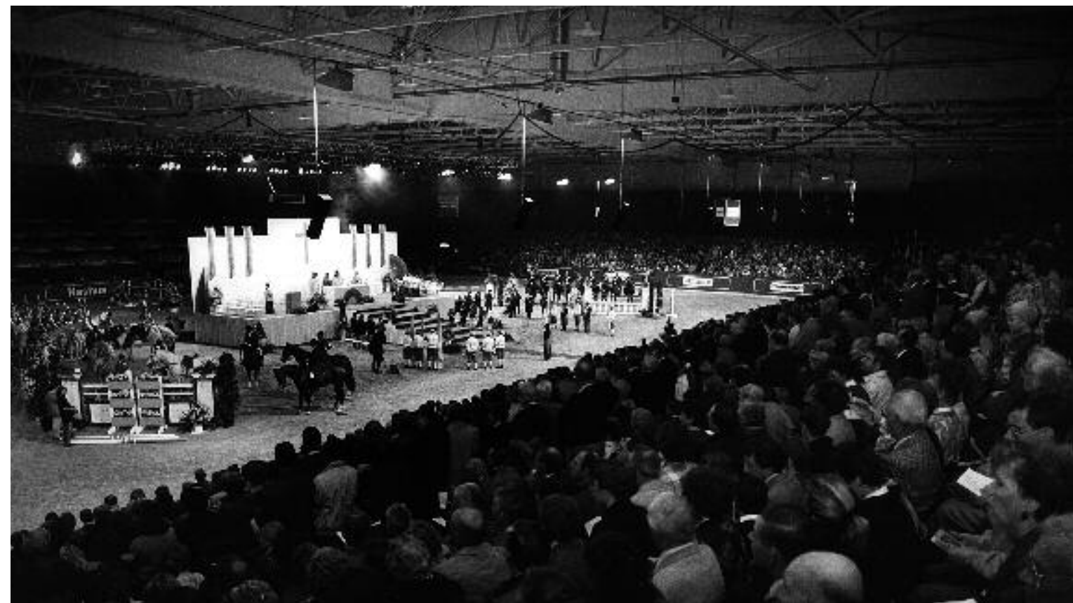
Jumping Indoor Maastricht met een eucharistieviering in het MECC op Sint-Hubertusdag, 3 november 1988.

Door de leegloop van de binnenstad naar de nieuwe buitenwijken raakten de historische binnenstadparochies in grote financiële problemen. In 1964 werd de Sint-Josephkerk aan de Kesselskade buiten gebruik gesteld. Sindsdien is het hergebruik van deze voormalige Augustijnenkerk een regelmatig terugkerende aangelegenheid in de Jaarboeken geweest. Hetzelfde gold voor andere historische kerken in de binnenstad. De Jezuïetenkerk aan de Tongersestraat werd in 1966 gesloten wegens gebrek aan kerkgangers en in 1979 werd het complex afgebroken. Vanuit het bisdom